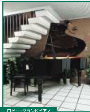
ロビー・グランドピアノ